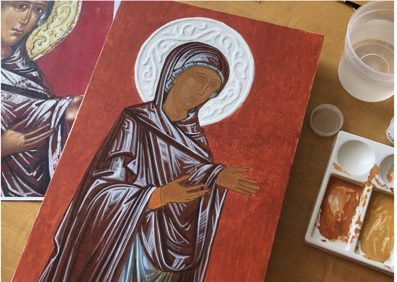
Робота над іконою в школі «Радруж»

Іконографічна традиція Церкви — це результат тривалих пошуків і спроб, спрямованих на те, щоб уприсутнити зображену Особу і вказати нам на Її святість, на Її божественність. Тобто на щось, чого фізичними очима ми не можемо побачити, а водночас намагаємось зобразити. Ця напруга визначальна не тільки для богословського підґрунтя ікони, а й для існування Школи українського іконопису «Радруж» УКУ, яка в Києві діє при Інституті святого Томи Аквінського, — простору, де іконопис сприймають як шлях пізнання, молитви й відповідальності за власну традицію.