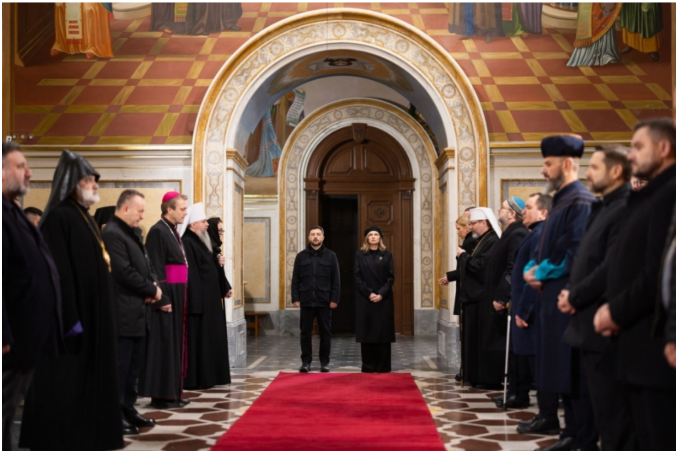
Фото з молитви в день пам'яті жертв голодомору, 2025 рік

Перший і доволі регулярний привід, коли християни різних конфесій (а часто й представники різних релігій) збираються разом, — це офіційне і наполегливе заохочення державної влади до спільної молитви. Так трапляється, наприклад, на День Незалежності України, коли до Софії Київської запрошують не лише християн, а й мусульман і юдеїв. Чи — як принаймні 2025 року — в День спомину жертв голодоморів в Успенському соборі Києво-Печерської лаври.