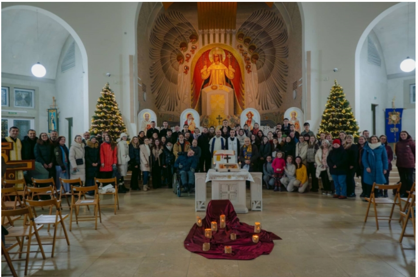
Фото з Тижня молитов за єдність християн, 2024 рік

У Львові, принаймні протягом останнього десятиліття, Тиждень молитов за єдність християн координує Інститут екуменічних студій. У 2024 році це була молитва з піснями у стилі Тезе в храмі святої Софії Премудрості Українського католицького університету.