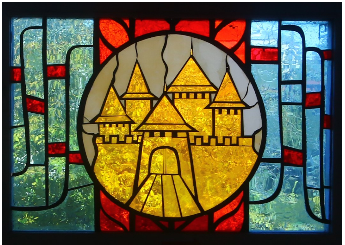
Вітраж Івана Кляпетури

Маленькі західноукраїнські райцентри переважно бідні на масштабне монументальне мистецтво, одну з головних прикрас 1970–1980-х років. Тут нечасто були великі промислові об'єкти з їдальнями, клубами чи спорткомплексами, на стінах яких можна було вимальовувати фрески й викладати мозаїки.