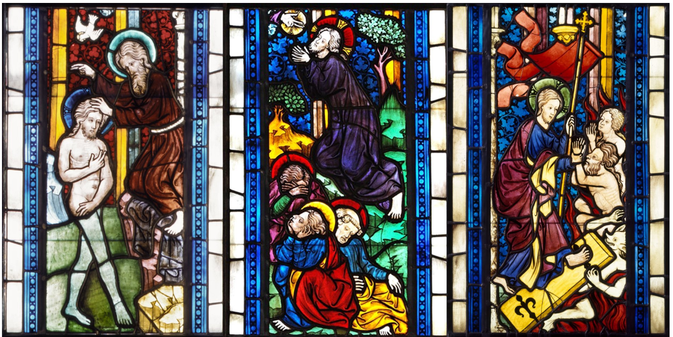
Сцени з життя Христа на австрійських вітражах XIV

Класичний вітраж, створений сьогодні, ґрунтується на традиційних методах Теофіла (звісно, з поправкою на надбання технічного прогресу), але є також численні нові техніки виготовлення вітражів із застосуванням різних матеріалів і виробничих можливостей. Отже, сучасне визначення має бути приблизно таке: вітраж – це об'єкт, виготовлений із прозорого кольорового матеріалу, призначений для того, щоб розглядати його у променях світла.