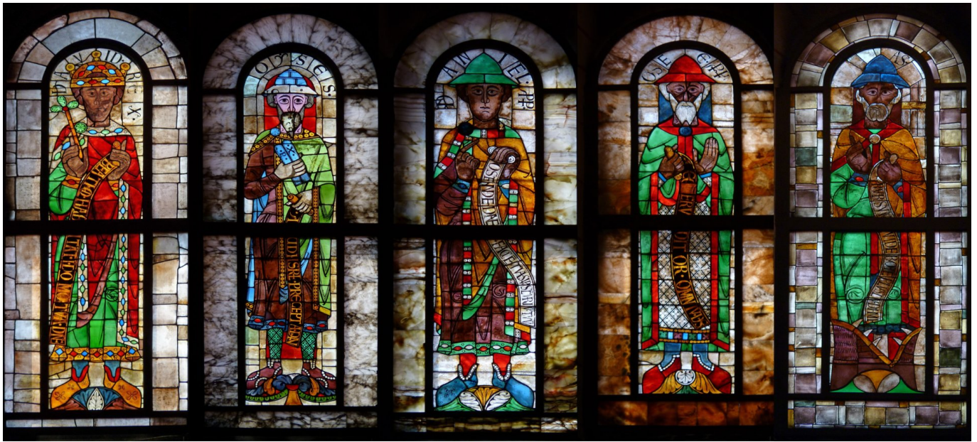
Старозавітні пророки на вітражах XI століття із аугсбурзького собору.

Зростання популярності й попиту на вітражні вікна призвело до того, що на зламі XI й XII століть ченець Теофіл Пресвітер створив підручник « Diversarum artium schedula », у якому детально та професійно описав три мистецькі техніки. Першу книгу він присвятив живопису, другу – вітражництву, а третю – золотарству. Сьогодні на підставі цього підручника можна відтворити методи середньовічних майстрів. Це довела, наприклад, магістерська робота, для якої в майстерні дослідження вітражів при факультеті реставрації Краківської академії образотворчих мистецтв було відтворено вітражні техніки, які описує Теофіл: виявилось, що його вказівки цілком реалістичні, а деякі техніки використовують у вітражництві й нині.